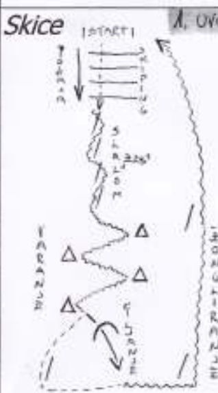
„POLIGON VOJENJE - OBLAZOVANJE ŽOGE“

3. INTENZIVNI DEL: IGRA S POVRATNO PODARO SKOZI VRATA → V pravokotnem polju so 4 vrata postavljena do vrata črna (črna, črna). 2 čipji igata med seboj, na točno se stige pravotna podaja črna poljubno vrata. Vsak igralca ima max. 3 dotise, pravotna podaja na točno se stige. Pravotna čipja pospravila radejici.